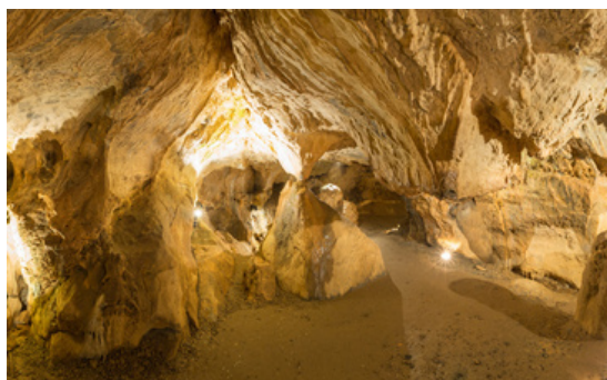
Excursions Patrimoine (Grottes de Saulges, Cité médiévale de Sainte-Suzanne...)