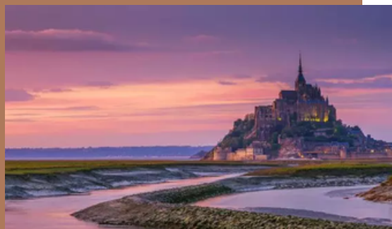
Echappée aux portes de la Normandie (Mont-Saint-Michel)

Et la page : https://domainedesvaulx.fr/les-activites/