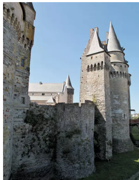
Escapades aux portes de la Bretagne (Cité Médiévale de Vitré et Château de Fougères)