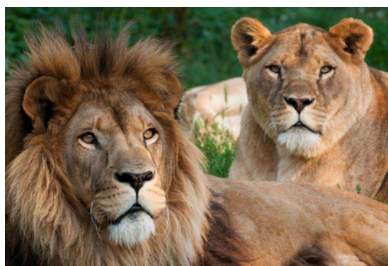
Plaisirs en famille (Refuge de l'Arche, accrobranche à Gorron...)