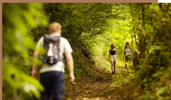
Randonnées mayennaises (Chailland) Idées de circuits : https://chailland.fr/cartes-de-randonnees